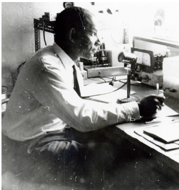
F9IV à sa station et lors d'un repas dans le 14