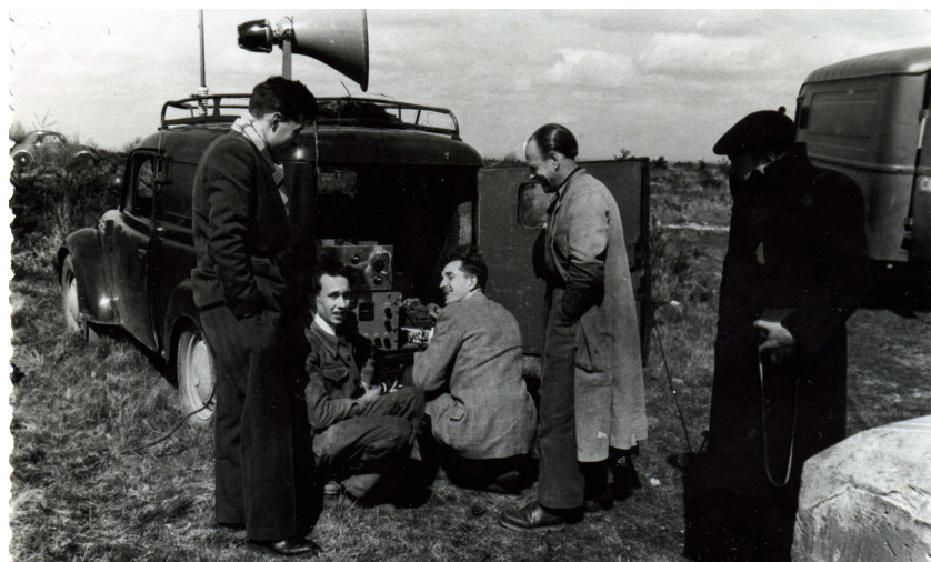
Inconnu, F9VT, F8PB, F3RL, inconnu ; tous derrière la Juva 4