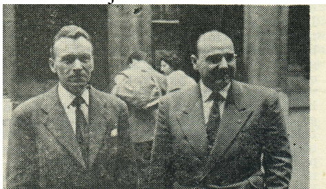
Deux solides piliers du RU : F8MW/3 (à gauche), et F8KC/1 (à droite)

Une photo représentant F8MW et F8EL est jointe à l'article