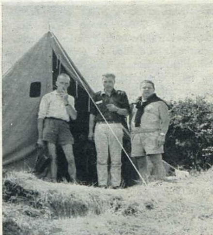
De gauche à droite : F2UM, F3DX, F9MR.

— Trafiquer très rapidement. Les longues palabres vous font perdre des QSO. Il faut penser à ceux qui vous appellent !