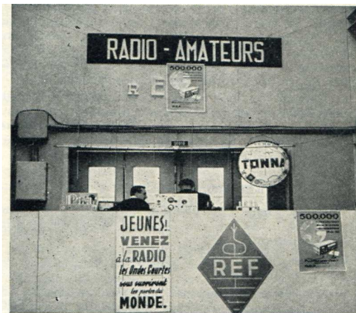
Le stand du REF à la foire de Caen.