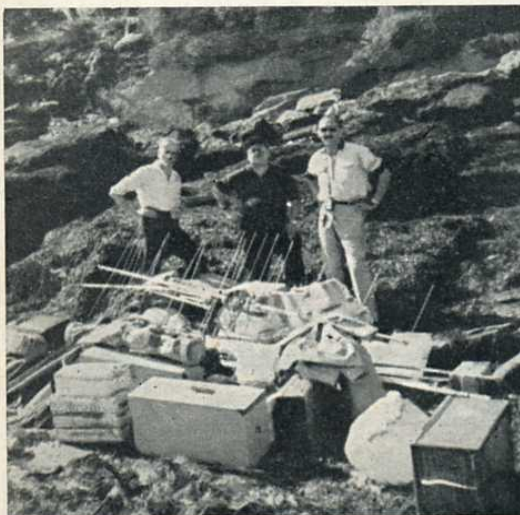
Comment transporter tout cela semblent se demander F2UM, F9MR, F2WS.

Les paquets amoncelés sur les rochers à même le varech, doivent attendre 3 heures pour être chargés sur l'unique camionnette de l'île, gracieusement prêtée par M. Blondeau, hôtelier.